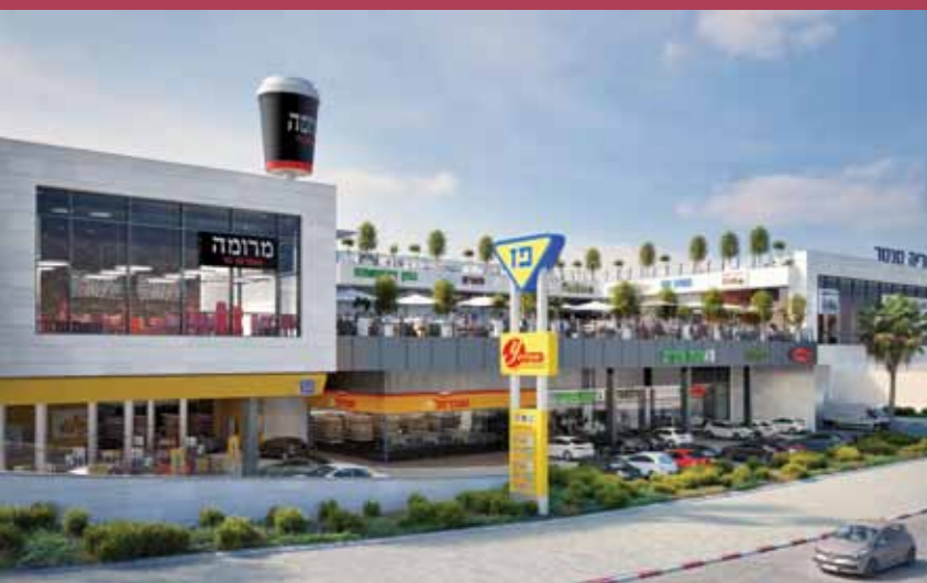
אריאל סנטר - מרכז מסחרי