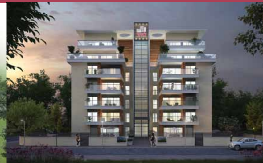
ARTISTS - משכנות אומנים מוצקין