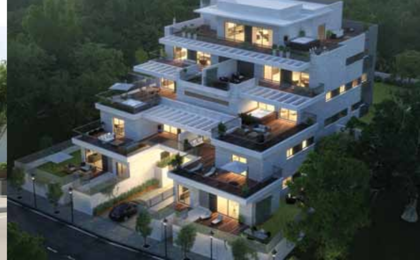
מדורגי התאנים - ק.אתא