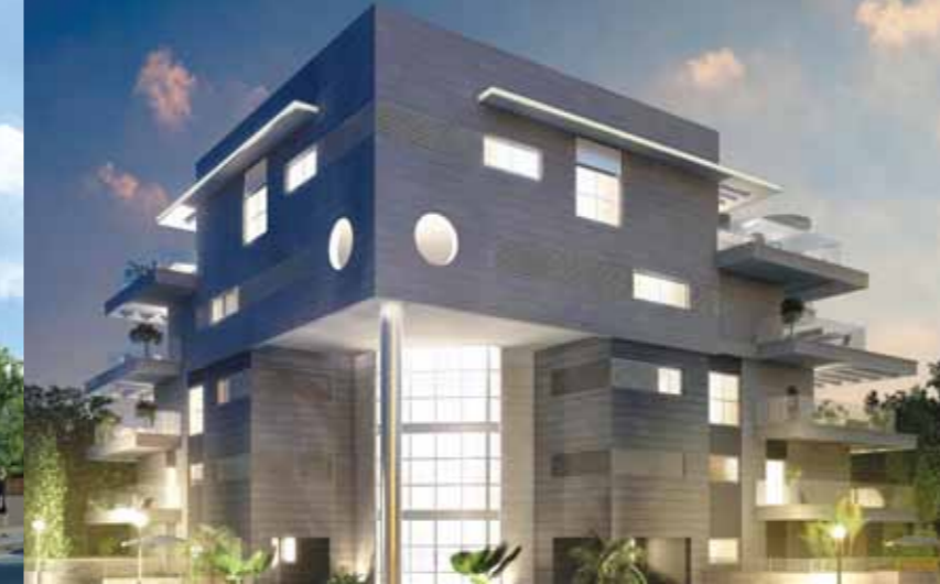
נוף הכרמל - ק.אתא