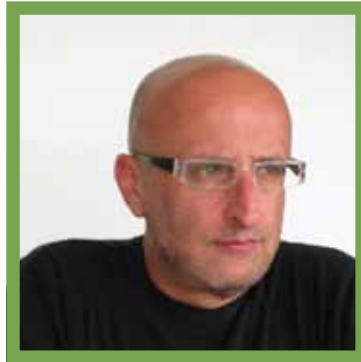
האדריכל פרופסור גבי שורין