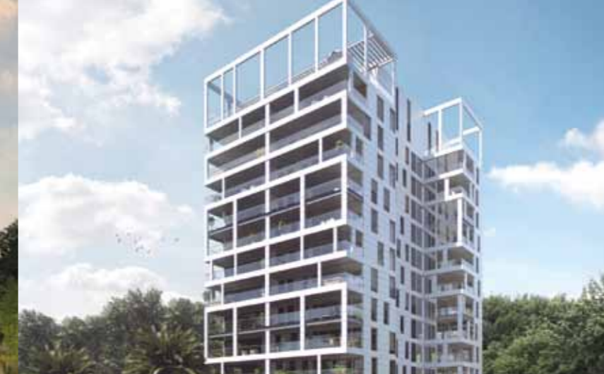
פיבקו מול הים - חיפה