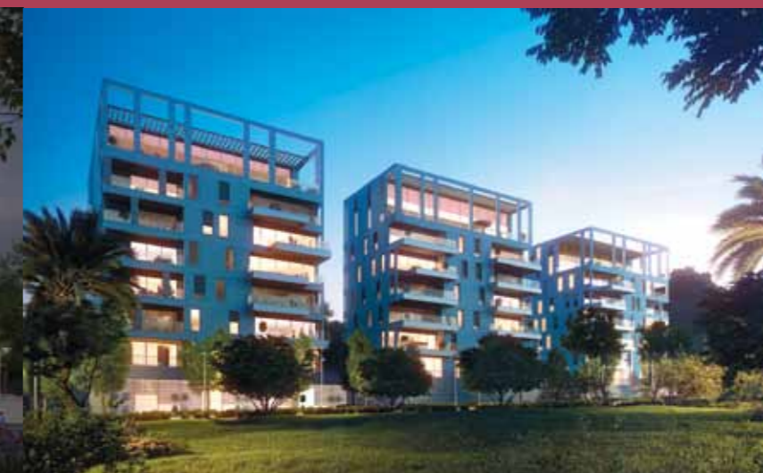
פיבקו מול הים - חיפה