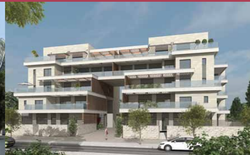
פנינת התאנים - ק.אתא