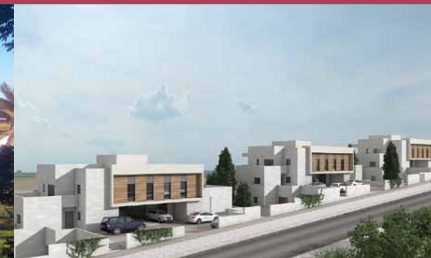
הר כרמי - כרמיאל