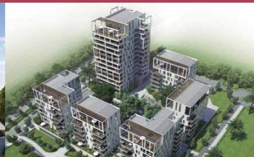
פיבקו מול הים - חיפה