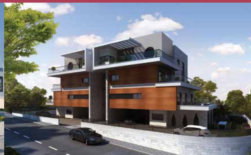
השופטים - ק.אתא