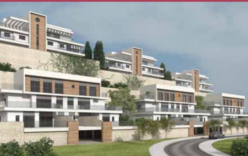
הר כרמי - כרמיאל