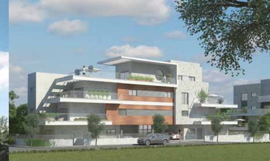
הנביאים - ק.אתא